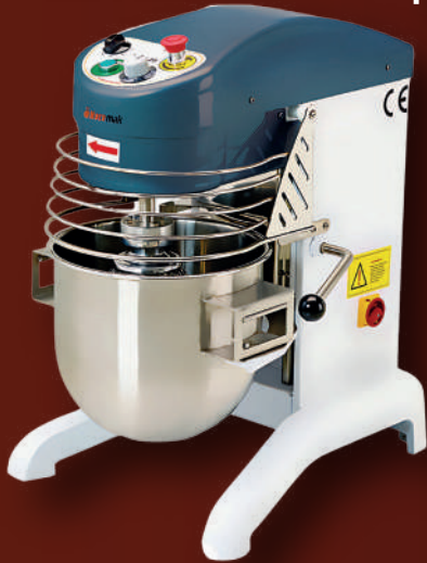
PLM 40 PLM 60